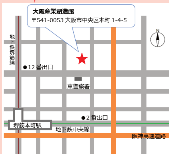
地下鉄 堺筋本町駅 下車 ②番、⑫番出口より 徒歩5分