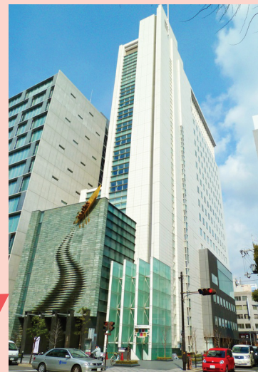
大阪産業創造館5F研修室C