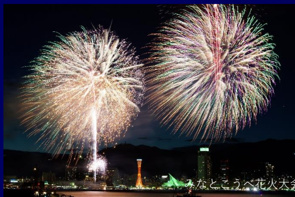
みなとこうべ花火大会

音楽と花火が融合する花火大会、花火の前は同時開催の「MUSIC CIRCUS'18」音楽フェスで楽しんで花火に突入しよう!!